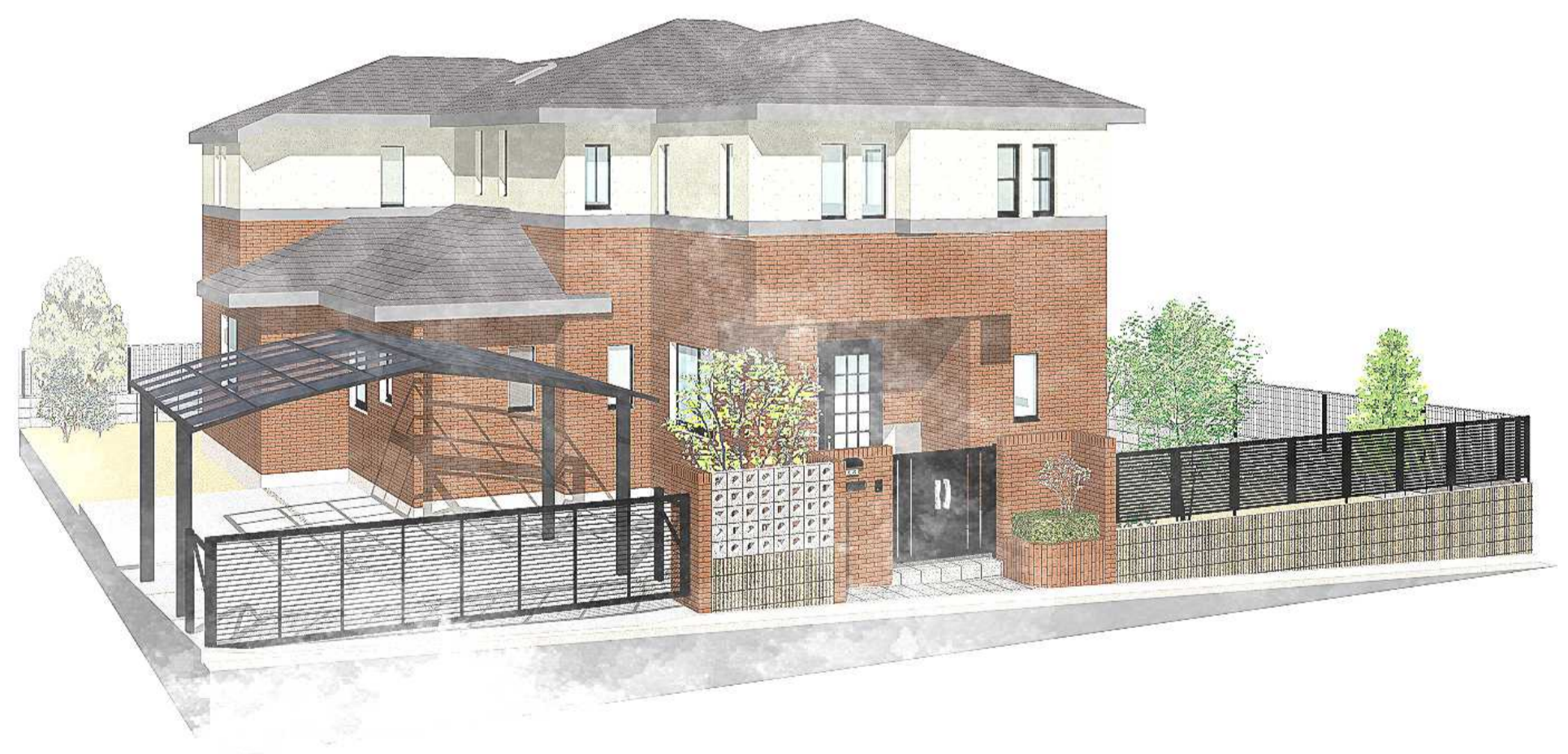
外構工事完成予想図